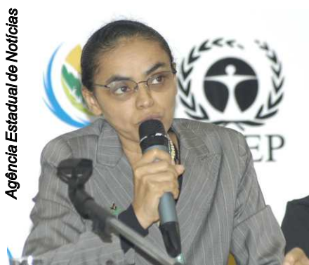
Agência Estadual de Notícias