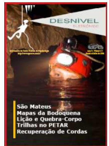
Capa do Desnível Eletrônico nº 5

A União Paulista de Espeleologia - UPE, grupo filiado à SBE(G075), acaba de lançar o 5º número do seu boletim "Desnível Eletrônico".