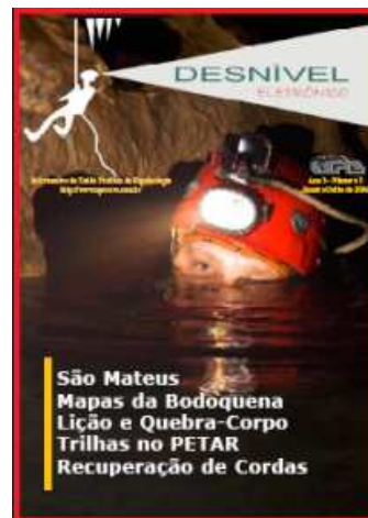
Capa do Desnível Eletrônico nº 5

A União Paulista de Espeleologia - UPE, grupo filiado à SBE(G075), acaba de lançar o 5º número do seu boletim "Desnível Eletrônico".