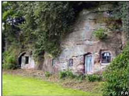
Vista frontal da casa e caverna leiloada

Uma residência construída dentro de uma caverna em Worcestershire, na Grã-Bretanha, foi vendida por 100 mil libras (cerca de R$ 390 mil). A casa, que possui porta de entrada, lareira e despensa, foi leiloada por um valor quatro vezes maior do que a avaliação, segundo a BBC.