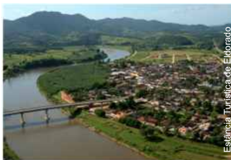
Vista aérea do rio Ribeira de Iguape e de Eldorado-SP, antiga Xiririca da Serra

çaria dali a pouco. Ele era professor de uma escola rural e iria participar, declamando um poema da própria Francisca Júlia. Estava nervoso por isso. Muito nervoso. Gostei. Paguei mais uma cachaça pra ele, depois outra, e tomei algumas também. Conversamos até um pouco antes de chegar a vez dele declamar, já bem mais calmo, mas um pouco chumbado pelo álcool.