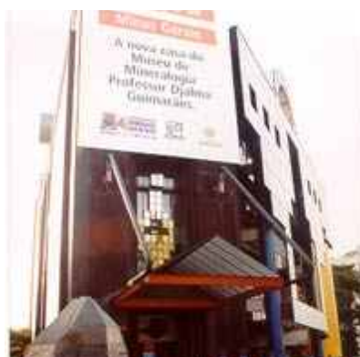
Museu de Mineralogia Prof. Djalma Guimarães

Gerais, cerca de 10 a 15% de outros estados e o restante de outros países.