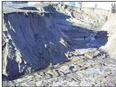
A cratera deixada pelo lago que sumiu