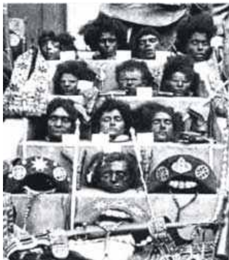
Exibição Macabra - Depois de mortos, Lampião e membros do seu bando foram decapitados e as cabeças colocadas em exibição pública

Entre outros aspectos, o Plano de Manejo vai contemplar o ordenamento do turismo ecológico, segmento que deverá ser fortemente estimulado com a implantação da UC, conforme as expectativas da Secretaria de Meio Ambiente e Recursos Hídricos.