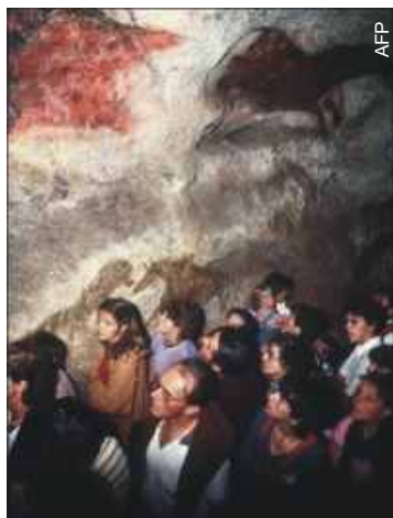
Gruta de Lascaux - França