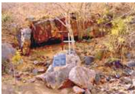
Grota do Angico

Natureza e história preservadas em uma tacada só. Essa é a proposta básica da primeira unidade de conservação estadual de Sergipe o Monumento Natural da Grota do Angico -, cujo processo de implantação encontra-se em andamento.