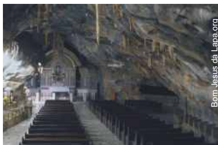
Bom Jesus da Lapa.org

Brasil passou por várias obras públicas. Mas a transposição é, até onde a vista alcança, a primeira que começa superfaturando gente, uma conta fácil de verificar no site do IBGE.