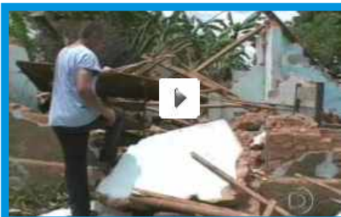
Clique para assistir a reportagem da TV Globo