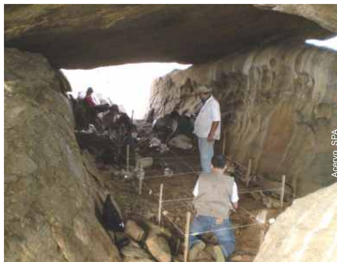
Escavações na Fuma da Barra - Camalaú-PB

que foi largamente utilizada entre as sociedades pré-históricas para a confecção de artefatos cortantes. O mineral não existe na região, portanto foi trazido para o abrigo e pode ter sido utilizado para descarnar ossos no ritual fúnebre.