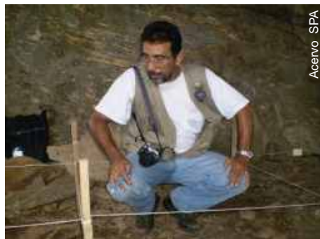
Presidente da SPA documentando o trabalho

Com o apoio do CNPq, o Núcleo de Documentação e Informação Histórica Regional (NDIHR) da Universidade Federal da Paraíba e a Sociedade Paraibana de Arqueologia (SPA), iniciaram entre os dias 23 e 25 de novembro do corrente uma escavação arqueológica numa necrópole indígena na região do sítio Barra, município de Camalaú, no Cariri da Paraíba.