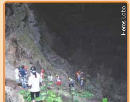
Quais os limites aceitáveis para visitação?