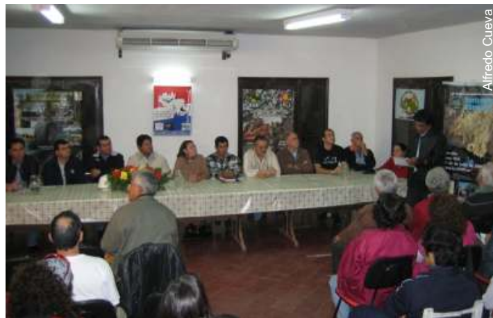
Abertura oficial da Expedição FEALC ao Paraguai

O Paraguai, que surgiu no cenário espeleológico internacional apenas em 2005, foi palco da “Expedição Científica Espeleológica FEALC 2008”, realizada no período de 2 a 6 de junho nas cavernas de Vallemí, pequena cidade do centro-norte daquele país.