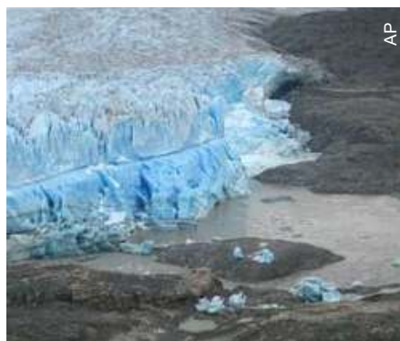
Lago Cachet quase vazio em abril

O lago de origem glacial, situado 1.700 quilômetros ao sul de Santiago, em Campo Hielo Norte, havia se esvaziado anteriormente devido às altas temperaturas que passaram de 35 graus centígrados no último verão.