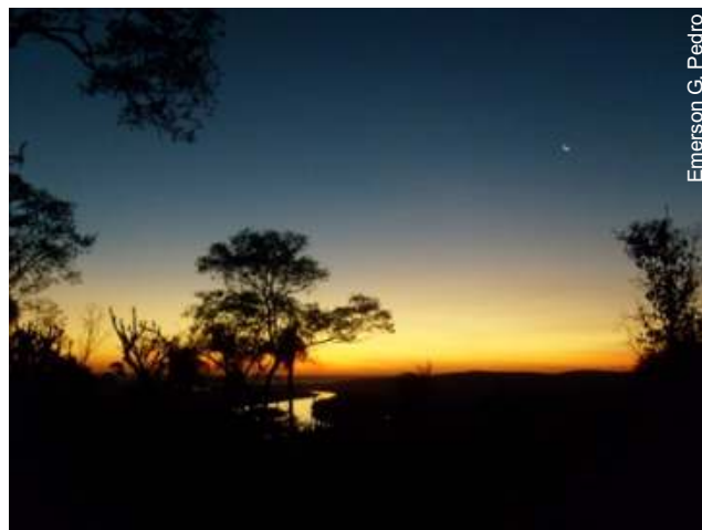
Pôr-do-sol no Rio Apa a caminho de Vallemí (Paraguai)