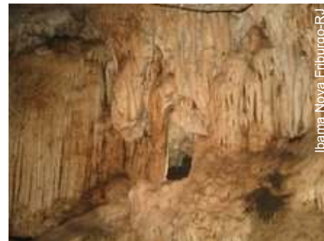
Ibama Nova Friburgo-RJ

Técnicos do Centro de Estudo, Proteção e Manejo de Cavernas (CECAV/ICMBIO) farão uma vistoria à caverna Pedra Santa, em Cantagalo-RJ, no dia 01 de julho com objetivo de catalogá-la e avaliar as formas de uso da caverna.