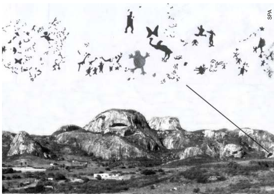
Foto-montagem destacando as inscrições rupestres da Pedra da Santa

No Parque existe um senso geral de preservação, muita movimentação turística e um controle eficaz dos visitantes por parte dos guardas florestais. Exemplo, no interior da Paraíba, de exploração sustentável e ecologicamente correta para um nicho de atrativos naturais e arqueológicos.