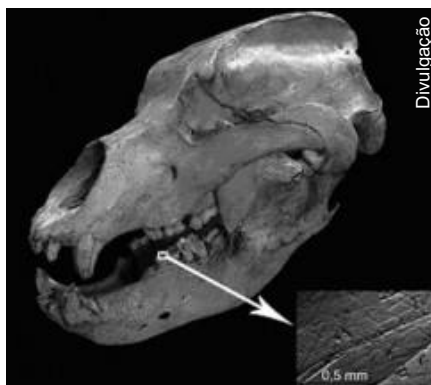
Esmalte dos dentes foram a chave da pesquisa

O urso da caverna, spelaeus Ursus , é uma espécie extinta há 28.000 anos, ainda assim, é possível saber como se alimentava.