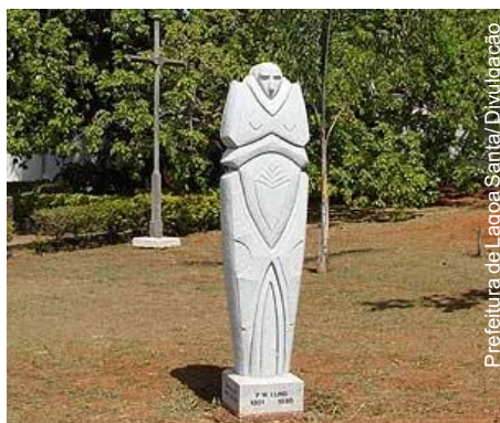
Estátua de Lund veio da Dinamarca