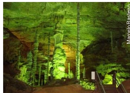
A gruta é turística com passarelas e iluminação

O Governo de Minas Gerais, publicou dia 26 de agosto uma lei instituindo a área da Gruta Rei do Mato, em Sete Lagoas, como Monumento Natural Estadual.