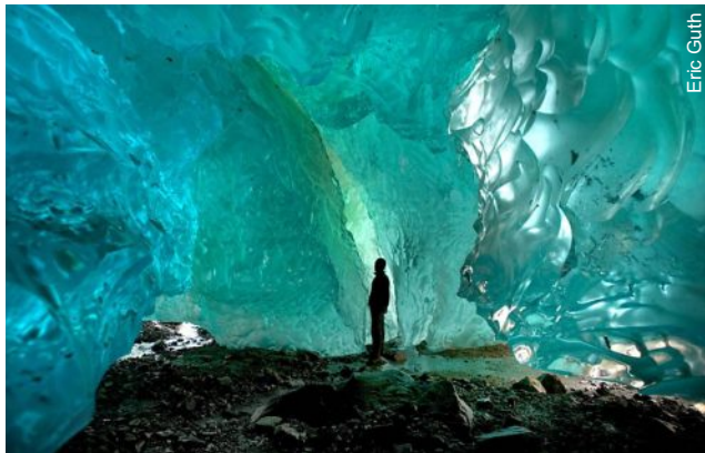
Clique na imagem para ver mais fotos das cavernas de gelo