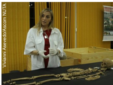
A antropóloga física Eugênia Cunha acredita que muitos vestígios ainda podem ser encontrados na região da hidrelétrica

O Núcleo Tocantinense de Arqueologia (NUTA) da Fundação Universidade do Tocantins (Unitins) está analisando oito restos de esqueletos encontrados na Ilha dos Campos, próxima ao rio Tocantins, entre os municípios de Aguiarnópolis (TO) e Estreito (MA). Os restos, que provavelmente são de índios Guaranis, estavam dentro de urnas (com formato oval e feitas de cerâmicas) no sítio abrigo Santa Helena (uma espécie de caverna formada por paredes rochosas, lugar que foi submerso depois da construção da Usina Hidrelétrica de Estreito).