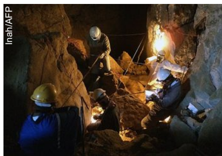
Em agosto de 2011, arqueólogos trabalharam na caverna de La Sepultura

grupos de 10 mil a 12 mil anos antes de Cristo", afirmou o antropólogo físico Jesús Ernesto Velasco, do Centro Inah-Tamaulipas, citado no comunicado.