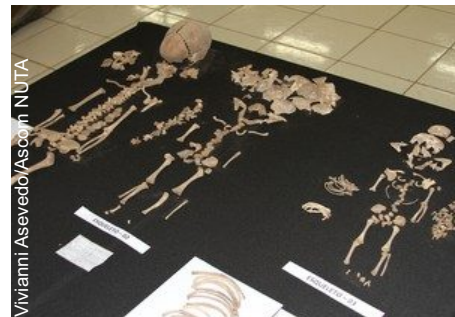
Ossada de 3 crianças indígenas encontrados em uma só urna

O trabalho feito pelo NUTA tem o objetivo de resgatar histórias e fazer um monitoramento histórico e cultural das regiões impactadas. No local, onde hoje só se vê água da Usina Hidrelétrica de Estreito