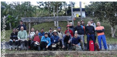
Resultados desta etapa do projeto serão divulgados em breve

No dia 03 de agosto foi realizado mais uma expedição do PROCAD (Projeto Caverna do Diabo) em Eldorado/SP, com a participação de diversos grupos espeleológicos (GELS, GESCAMP, Trupe Vertical e UPE), Sócios Individuais, Instituto Florestal, Polícia Ambiental, AMAMEL e inclusive da nova Gestora do