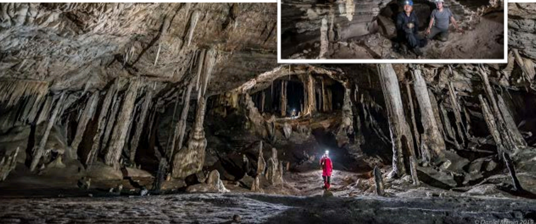
Fotos 1 e 2 (abaixo e ao lado): Caverna do Jerônimo e Toca da Boa Vista. Daniel Menin

Outra caverna pesquisada foi a Gruta do Jerônimo, localizada no município de Uauá. A Gruta se encontra no topo de uma montanha-testemunho e faz parte do parque municipal da Serra do Jerônimo. Embora seja um ponto turístico, até então a caverna não tinha um mapa desenhado. Além da topografia, os pesquisadores realizaram coleta de espeleotemas já depredados por antigas atividades de extração de salitre e visitação desordenada (foto2). Grandes salas e formações caracterizam a caverna. Embora tenha registros de depredação, a Gruta do Jerônimo ainda apresenta relevante valores pedagógico e estético contendo inúmeras colunas e formações. Mais fotos e informações podem ser encontradas no site http://terrasubespeleo.blogspot.com/