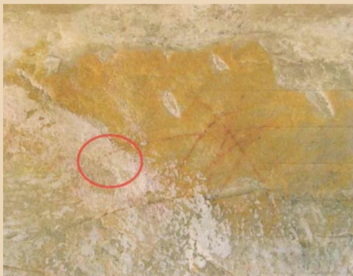
Foto: Divulgação MPMG. Imagem mostra a sobreposição de camada branca ao grafismo rupestre em Diamantina.

Fonte: https://brasil.elpais.com/brasil/2020-02-16/record-e-condenada-a-pagar-dois-milhoes-de-reais-por-pintar-de-branco-arte-rupestre-em-diamantina.html?ssm=FB_CC&fbclid=IwAR3AiZG9uVX9PxxFinT TDUnmZwXFoQiBHQ-nToAmZBTeJBMe663rNAekluk