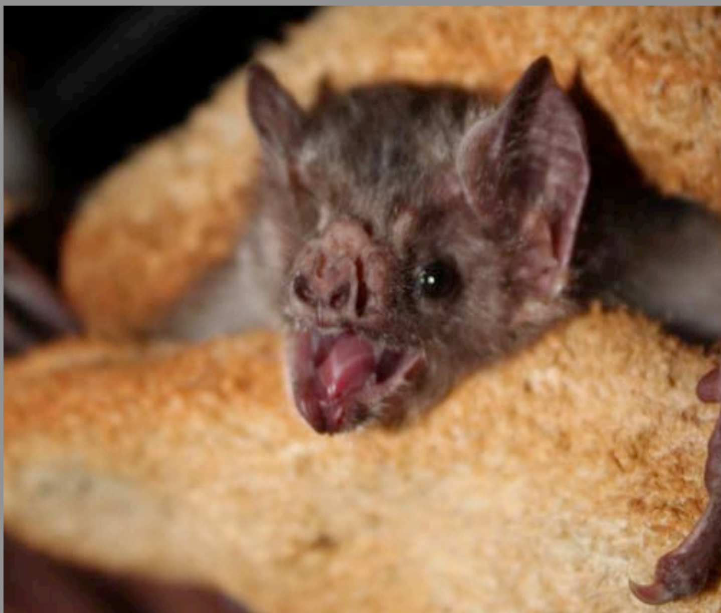
Foto: Morcego hematófago Desmodus rotundus sendo manipulado durante estudo em cavernas (Rafael Balestieri dos Santos)

Morcegos são animais extremamente importantes para os ambientes cavernícolas e devem ser estudados e preservados. Se as suas dúvidas sobre coronavírus ou outras doenças zoonóticas aparentemente associadas a morcegos persistirem, não hesite em contatar a SBEQ por meio do sbeq.duvidas@gmail.com .