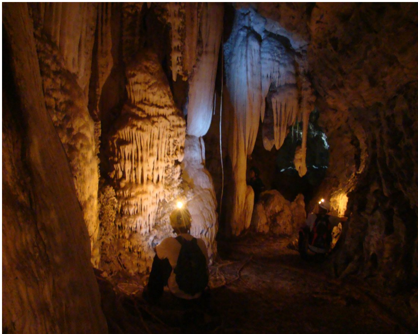
Caverna do Japonês (Pindorama do Tocantins TO) Foto: Fernando Morais - vide página 26