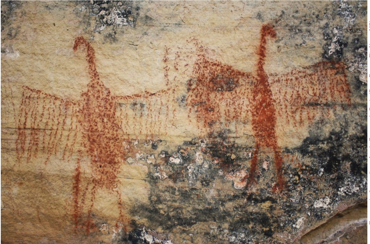
Representações oritomorfas da Caverna da Santa (Serra Brava - Rio Negro MS) - vide página 122