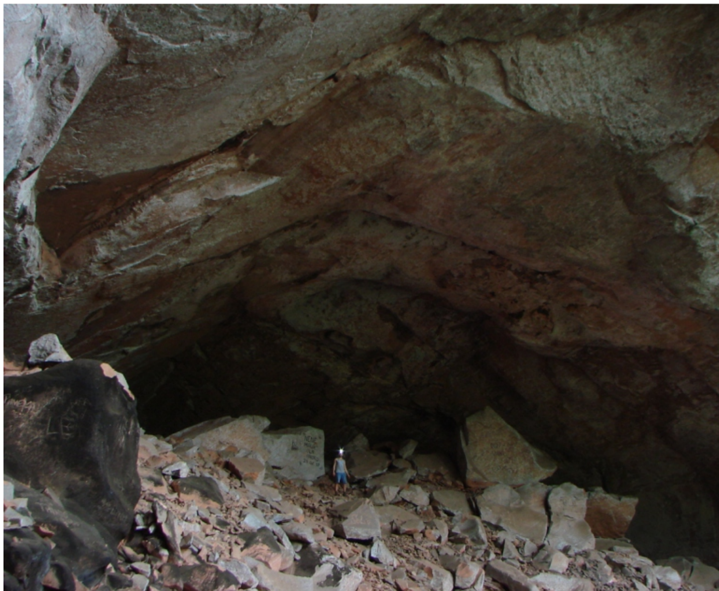
Imponente Pórtico da Gruta da Boca do Sapo (SP-182) - Itirapina SP - vide página 16