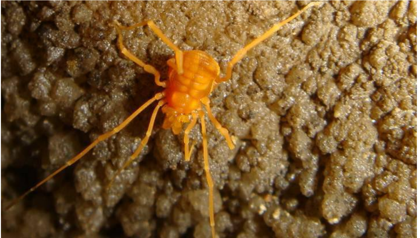
Opiião troglóbulo ( Gonyleptidae: Pachylinae ), Caverna Santana(SP)