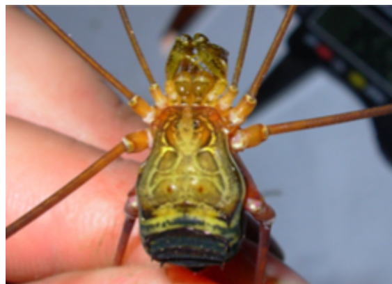
Figura 1. Goniosoma sp.