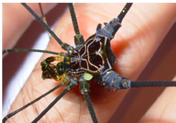
Figura 2. Goniosoma albiscriptum (Mello-Leitão, 1932).

2. Goniosoma albiscriptum : Sua ocorrência é assinalada na Serra do Mar (SP). Esta espécie é encontrada em abrigos de rochas ao longo do leito de riachos e em grutas graníticas (Fotografia 2).