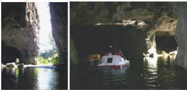
Fotografias 9 e 10: Pórtico da Gruta dos Anjos e passeio de pedalinho no interior da cavidade. Érica Nunes, mar. de 2007.

A visita é realizada com auxílio de monitores locais, sendo que, no local, existem monitores com experiência e formação em atividades com PNE's.