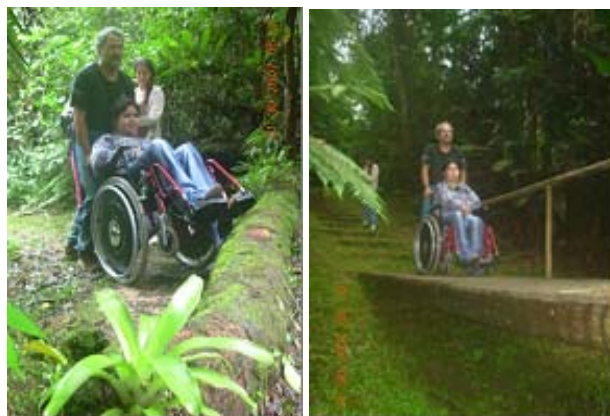
Fotografias 1 e 2: Tronco caído (obstáculo) e ponte em boa condição na trilha que leva a Gruta do Chapéu.

Para percorrer esta trilha o cadeirante necessita de ajuda, já que existem alguns lances de escadas e um tronco de árvore obstruindo a passagem. Entretanto é possível superar estes obstáculos o que torna o passeio ainda mais atraente ao visitante.