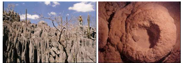
Fotografias 3 e 4: Vista geral do exocarste sobre a Gruta dos Sons e Pia batismal com pérola em forma de coração

pequeno canídeo próximo a uma clarabóia no trecho inicial da caverna.