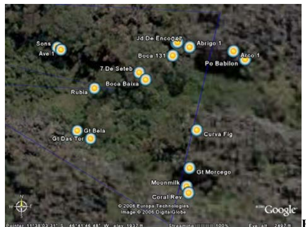
figura 3: Imagem de satélite com cavidades encontradas na Faz. Vale Verde (Dianópolis-TO).

A equipe de prospecção trabalhou contornando os afloramentos calcáreos. Neste local, a vegetação é composta principalmente por bromeliaceas do gênero Tilandsia sp., cactaceas do gênero Cefalus sp., além de barrigudas, urtigas, emburanas, pente de macaco, araçás, ipês, jacarandás, gameleiras, mamica-de-porca, dentre outras.