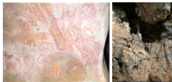
Fotografias 1 e 2- Pinturas rupestres e pórtico da Gruta Imperial (E. G. Pedro).

A cavidade possui pinturas rupestres (Fotografia 1) da Formação São Francisco, em bom estado de conservação, no seu pórtico de entrada em dois pontos diferentes. O primeiro painel encontra-se a um metro de altura e os desenhos estão em uma área de aproximadamente quatro metros de comprimento. O segundo painel está a aproximadamente seis metros de altura em uma seqüência de lances de escalada. Há duas bocas e três janelas em seu paredão principal, sendo que não foi encontrada nenhuma boca no lado oposto do maciço. O pórtico de entrada (Fotografia 2) possui três metros de altura por quatro de largura e para seu acesso é preciso vencer um trecho de escalada (composto por blocos) de aproximadamente quatro metros.