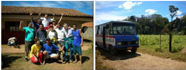
Fotografias 9 e 10: Equipe de espeleólogos da 3ª Expedição Tocantins e Veículo utilizado durante a expedição.

Desta maneira foi possível ampliar a atuação da Sociedade Brasileira de Espeleologia na região e contribuir com a formação de recursos humanos, viabilizando a difusão do conhecimento sobre os ambientes cársticos e do potencial ecoturístico da região com vistas a uma utilização sustentável, além do estímulo para a criação de um grupo de espeleologia local.