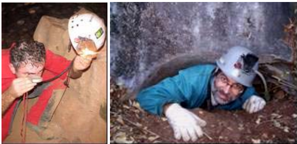
Fotografias 5 e 6: Trabalhos de topografia e prospecção na Gruta da Imburana e na Furna do Quebra-Ossos.

No dia 25 e 26, nosso destino foi uma área de afloramentos calcários localizados a aproximadamente cinquenta metros da área urbana do município de Novo Jardim. Trata-se de um exocarste com forte lapiezamento. Em campo, a equipe de exploração (Fotografia 6) localizou uma gruta denominada de Gruta da Emburana; indicada por um morador local. A emburana (também conhecida como, imburana, umburana, imburana de cheiro) é uma árvore da família das Fabáceas de ampla distribuição no país. Enquanto a equipe de topografia (Figura 5) trabalhava nessa Gruta, a equipe de prospecção continuou os levantamentos no entorno do maciço do Campo de Lapiás, finalizando as atividades na área com o registro de mais seis novas cavidades, a saber: Gruta da Emburana, Toca do Pulo do Gato; Furna da Onça; Gruta das Esponjas; Furna do Quebra-Ossos e Toca do Ferrão/Abismo dos Dois Irmãos além de uma visita a uma gruta já cadastrada ( Furna dos Lapiás TO33 ).