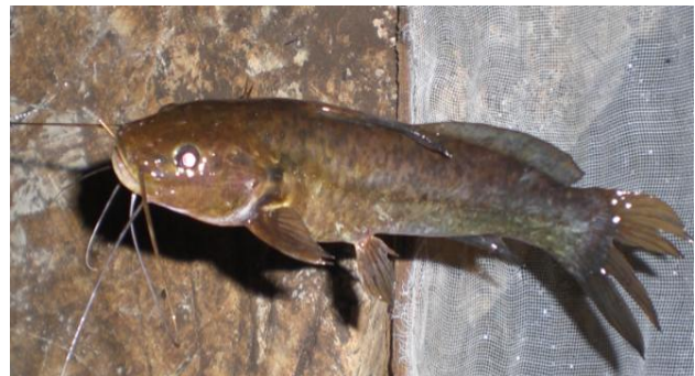
Figura 4: Rhamdia sp.

que a região apresenta marcante sazonalidade, onde no período chuvoso a caverna se encontra parcialmente submersa.