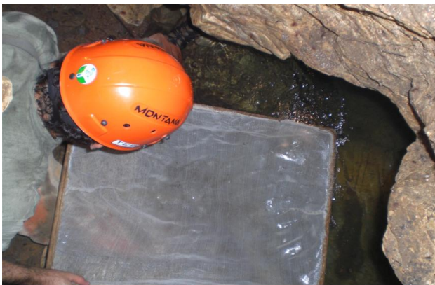
Figura 3: Material de captura de peixes.

que a região apresenta marcante sazonalidade, onde no período chuvoso a caverna se encontra parcialmente submersa.