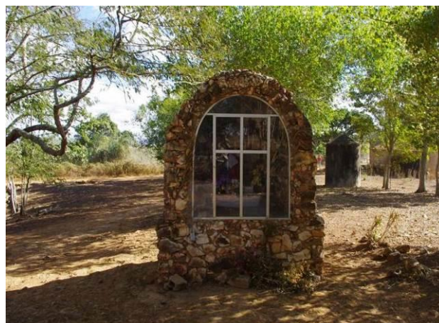
Figura 4 – Altar externo da Gruta do Bom Pastor, Paripiranga, Bahia.

Esta tradição não tem a sua origem presa ao passado remoto, nem ao menos surgiu a partir de evento especial, um milagre por exemplo. Ela foi criada pela Igreja com o único intuito de ampliar o seu leque de evangelização. Este é um exemplo de evento criado com a função de forjar uma futura tradição. Com o passar dos anos ela pode tornar-se uma forte tradição religiosa e assim se manter por si mesma, sem se apegar aos laços do passado que a criaram. Estes são exemplos de tradições inventadas.