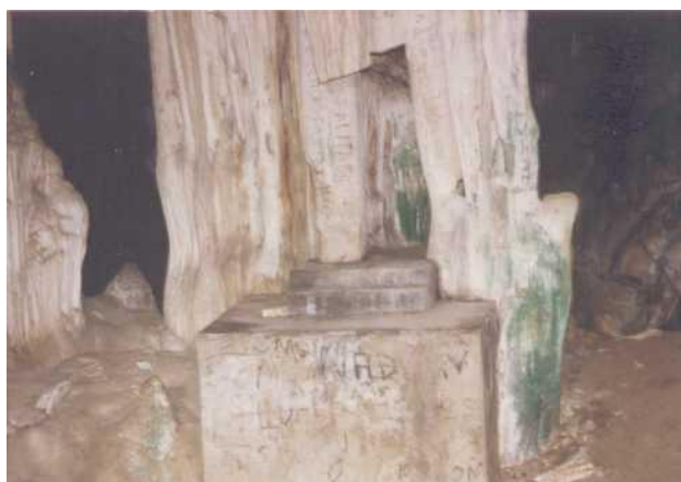
Figura 8 – Detalhe do altar da Gruta da Milagrosa, Pau-Brasil, Bahia.

No passado a gruta foi sacralizada e os ritos cristãos ocorriam de maneira normal naquele espaço, com realização de missas, casamentos e principalmente batizados. Com a retomada da área pelos grupos indígenas após um longo conflito pela posse e uso das terras, a área onde está a caverna foi incorporada à Reserva Caramuru-Paraguaçu, mas ela não deixou de ser sagrada para os índios. Embora não pertencesse mais ao rito cristão ela permaneceu como um espaço sagrado, agora reservado aos ritos dos grupos indígenas instalados na região. Houve a mudança do rito, mas permaneceu a tradição, agora com um outro enfoque religioso.