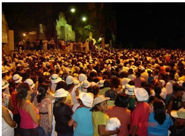
Figura 3 – Missa campal na entrada do santuário do Bom Jesus da Lapa, Bahia.

dos anos este espaço foi definitivamente sacralizado e defendido pela Igreja como um ponto de peregrinação importante aos inúmeros fiéis que creem na salvação feita pela tradição católica (Figura 3).