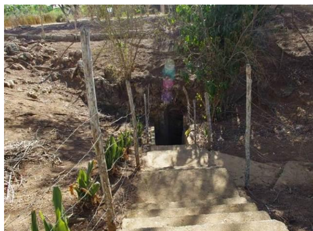
Figura 5 – Entrada da Gruta do Bom Pastor, Paripiranga, Bahia.

Bom Jesus da Lapa é tão inventada quanto o Bom Pastor, mas há um diferencial marcante entre as duas tradições: o tempo. Para a romaria de Bom Jesus da Lapa, o tempo distante é fundamental na manutenção e fortalecimento da tradição. Três séculos de rito criaram uma manifestação religiosa singular no sertão baiano e serviu para difundir e fortalecer a posição da Igreja naqueles rincões. Já a Gruta do Bom Pastor, a tradição foi criada há pouco mais de dez anos em um local onde houve a intenção de se criar um evento. Nesta caverna não houve o milagre, ou até mesmo a peregrinação inicial que desencadeou o processo, apenas a ideia inicial da Instituição religiosa. Com o passar do tempo, o rito foi entrando em desuso e a tradição não conseguiu se manter por si só. Hoje há uma vaga esperança da recuperação da peregrinação e ela vive apenas nas lembranças dos fiéis mais velhos. A tradição habita apenas a memória coletiva daqueles que participaram ao longo das três romarias, realizadas a cada dois anos, e que se tem notícia. O seu significado perdeu-se, não conseguiu se manter devido a sua debilidade original. Restou no local