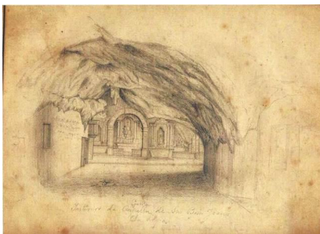
Figura 1 – Interior da Capela do Bom Jesus da Lapa, Bahia em desenho de Theodoro Sampaio, 1879. (Fonte: Ivoneide de França Costa, 2007).

dirigem a esta caverna em busca da realização de um milagre, transformaram a caverna, os seus arredores e aqueles que a frequentam. Ali ainda existe a natureza original, apesar dos elementos artificiais que ajudam a compor o cenário, ali persiste o espaço enquanto texto social. Ao mesmo tempo, não se consegue mais imaginar este espaço sob outro aspecto, remetendo-o à sua forma original antes da ação humana transformar o ambiente sacralizando-o, elevando-o a uma condição de espaço religioso, território sagrado. Ele foi transformado pela ação humana e ao mesmo tempo ele consegue modificar os atores que ali entram. É uma ação de reciprocidade.