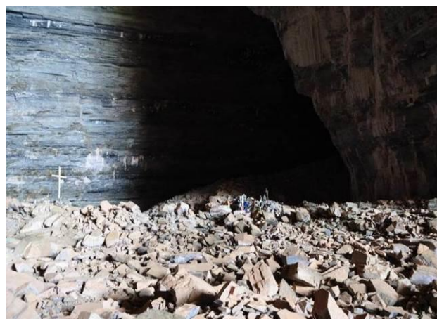
Figura 6 – Exemplo do arquétipo celeste oferecido pela divindade. Altar no interior da Lapa dos Brejões, Morro do Chapéu, Bahia.

A caverna faz parte desta resantificação constante, pois ela é parte integrante da própria criação e não apenas mais uma representação humana do arquétipo celeste. Ela é o próprio arquétipo celeste “oferecido” pela divindade ao Homem que ali construiu o seu elo ao tornar o espaço natural em sagrado. Pode ser visto como o local onde a divindade já se encontra e cabe ao Homem apenas delimitar o espaço de adoração, ao contrário das catedrais que são construídas para lá dentro colocar a divindade (Figuras 6 e 7).