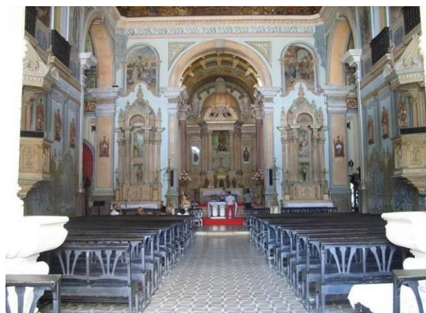
Figura 7 – Exemplo do arquétipo celeste construído pelo Homem. Interior da Catedral de Nossa Senhora do Rosário, Santo Amaro da Purificação, Bahia.

Na medida do possível, este espaço terá de reproduzir ao máximo as condições normais do imago mundi para que ele permaneça sagrado ao longo do tempo, independente de quem a sacraliza, como ocorreu com a sinagoga no Recife ou com a Gruta da Milagrosa no município de Pau-Brasil, cerca de 180 km ao sul de Itabuna, Bahia (Figura 8).