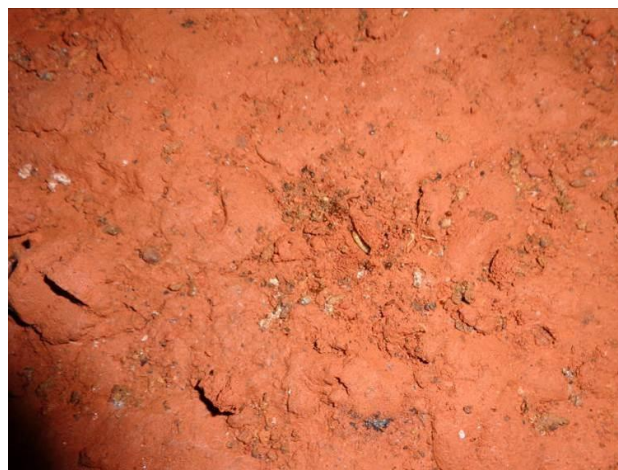
Figura 3 – Ao centro da imagem, exemplar de larva bioluminescente do besouro Elateridae (Pyrophorini).

Na fauna cavernícola da caverna Labirinto de Máfica - S11-07 ( GEM- 1614 ) destaca-se a ocorrência de larvas bioluminescentes do besouro Elateridae (Pyrophorini) (Figura 3) em diferentes condutos da caverna, em zonas de penumbra e afótica. Situam-se em fendas no substrato argiloso, ocorrendo em piso e paredes. Emitem luz esverdeada, responsável pela atração de diferentes presas, sendo observadas a predação de formigas, especialmente Solenopsis sp. e opiliões Escadabiidae durante os estudos de campo; a ocorrência de restos de exoesqueletos de presas na superfície lateralmente à fenda é comum. Adultos não foram registrados, indicando a possibilidade de uso da cavidade em apenas uma fase do ciclo de vida (trogloxenos). O registro de sua ocorrência nos dois períodos de campo e anteriormente, durante topografia, em 2008, indica o estabelecimento e uso da cavidade de forma prolongada. O registro é único para cavidades do país. Foram registradas ao menos 110 espécies na cavidade GEM-1614. Considerando os inventários faunísticos nos diferentes períodos sazonais, foram registradas 85 espécies na campanha úmida e 78 na campanha seca, sendo 53 espécies comuns às duas campanhas (ARCADIS tetraplan, 2011).