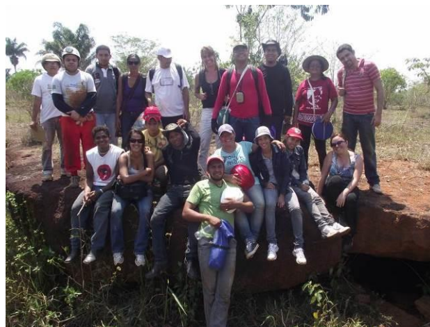
Figura 2 – Entrada Principal da caverna Labirinto de Máfica, com equipe da expedição.

outros. Os visitantes foram contemplados com a visualização da larva bioluminescente de besouro, que na ausência de luz emite uma luz verde tipo neon, o único registro no Brasil até o momento que se tem conhecimento é nesta caverna.