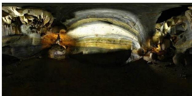
Figura 2 - Imagem QTVR do Salão 3 da Toca da Raposa.

No penúltimo tópico, “Matéria televisiva”, é encontrado o vídeo da matéria sobre a Toca da Raposa, apresentada pelo programa Terra Serigy da TV Sergipe. Nele foram abordados alguns dos aspectos geológicos e biológicos da caverna, mostrando a importância da conservação e desmistificando várias pré-concepções sobre a mesma.