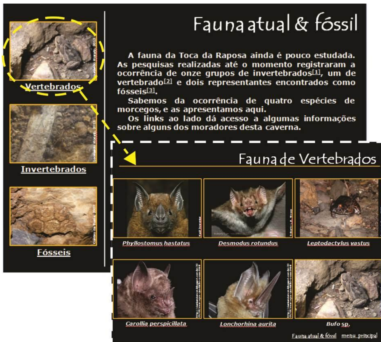
Figura 4 - Tópico sobre a Fauna atual e fóssil da Toca da Raposa. Em destaque, a tela sobre a Fauna de Vertebrados.