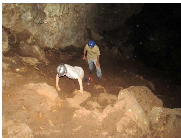
Figura 8. Paratleta sem as muletas durante a subida da rampa de saída da Caverna Pinhalzinho.