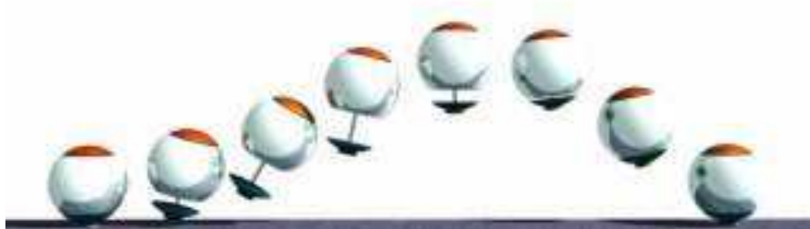
Os robôs saltitantes desenvolvidos pela NASA, ainda em fase de testes