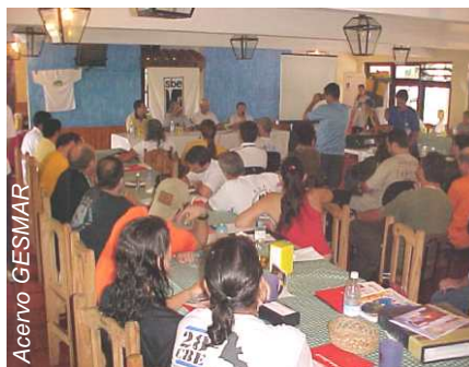
A cerimônia de abertura do XV Encontro Paulista de Espeleologia, em Eldorado (SP)

Após a cerimônia, os inscritos participaram das oficinas propostas, que contribuíram para troca de conhecimento e formação dos iniciantes em espeleologia (Introdução à Espeleofotografia, Fundamentos de Cartografia e Utilização de GPS, Tópicos de Manejo e Roteiros em Espeleoturismo, Básico de Técnicas Verticais e Noções de Geomorfologia em Áreas Cársticas) e no início da noite houve um breve histórico do PROCAD, que foi seguido de discussão entre os participantes levantando os pontos fortes e fracos das edições anteriores do projeto. Ao final da noite de sábado, os participantes fizeram uma confraternização para relembrar os velhos tempos, reencontrar amigos e conhecer os novos interessados em espeleologia. Foi um momento que ficará na memória dos presentes.