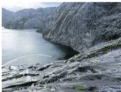
A Ilha Madre de Dios