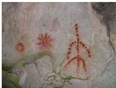
As escritas encontradas pela expedição

Entretanto, um dos momentos mais marcantes da viagem foi a