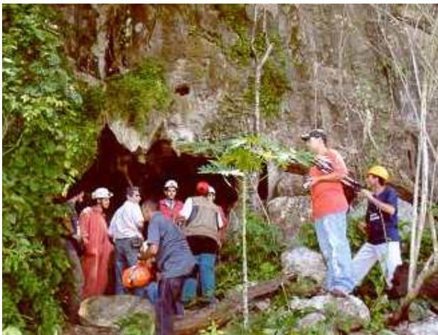
A equipe da expedição em frente à Gruta da Chapada

A equipe era composta por integrantes dos grupos Trupe Vertical, EGRIC e GESCAMP e visitou as regiões de Dianópolis, região central de Tocantins e Xambioá, ao norte.