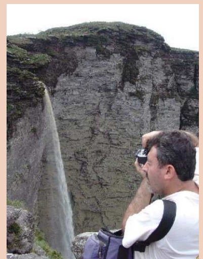
Obs: A palestra sobre Educação Ambiental, Conflitos Sociais e Unidades de Conservação do Alto Ribeira foi transferida para o dia 11/06/2006.