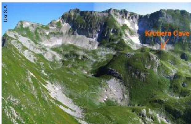
Localização da caverna Krubera, Maciço Arabika