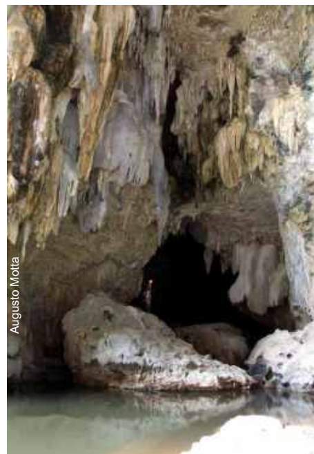
Caverna do Luis - Posse-GO

Uma vez constatada a operação ilegal, a informação foi repassada ao Escritório Regional de Alvorada do Norte - GO para que fossem providenciados os Autos de Infração e Apreensão e o Embargo da área.