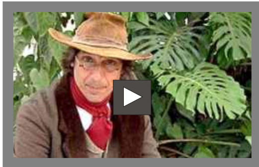
Clique na imagem para assistir ao vídeo ou na fonte para ler o texto completo