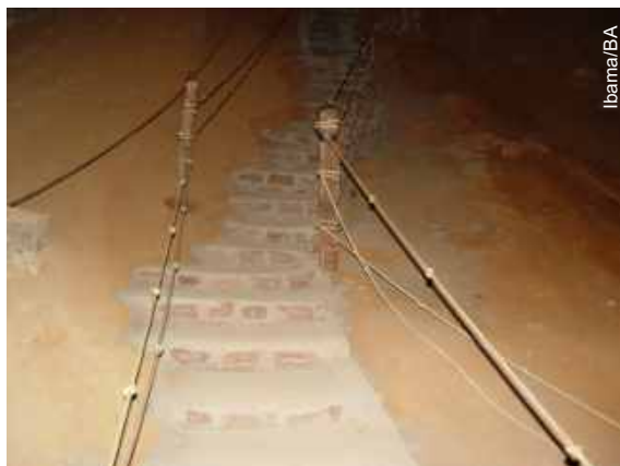
Escada de alvenaria construída sem autorização

Nesse momento, o Cecav está programando uma reunião com gestores ambientais do Ibama, SEMARH, Bahiatursa e representantes de empreendimentos turísticos da Chapada Diamantina, a fim de, juntos, encontrarem caminhos que possam resul-