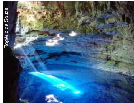
Poço Encantado (BA-202) Itaetê-BA