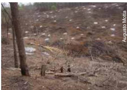
Área desmatada próximo à caverna

Fiscais do Ibama/GO realizaram atividades de monitoramento e prospecção espeleológica no Povoado do Luís, município de Posse-GO. Na região foi encontrado um desmatamento de 2,4 ha, em área de influência da Caverna do Luis.