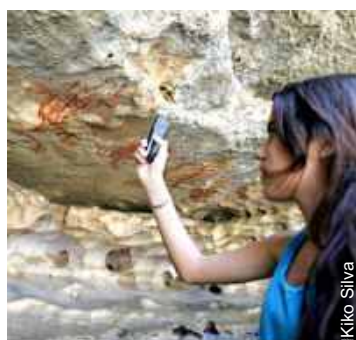
Inscrições rupestres são destaque