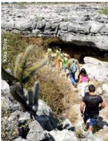
Turismo em Lajedo de Soledade

Além disso, a visita ao Lajedo se torna uma divertida brincadeira, quando, junto com os guias, os turistas tentam decifrar o significado dos desenhos pré-históricos ou mesmo caminhar pelas fendas e pequenas cavernas. Conhecer o Lajedo de Soledade é participar de uma fascinante aventura pelo sertão nordestino.