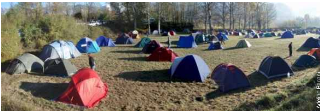
Acampamento organizado para os participantes de Apuane 2007 - Encontro Italiano de Espeleologia

da América Latina e Caribe- FEALC para os participantes da mesa e o público em geral que tinha pouca informação a respeito das duas entidades. Esta iniciativa foi coordenada e promovida tanto