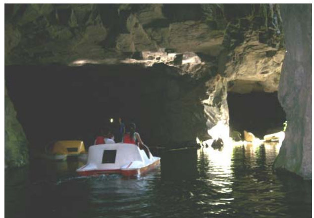
Fotografia 10: Passeio de pedalinho no interior da Gruta dos Anjos. Érica Nunes, mar. de 2007.