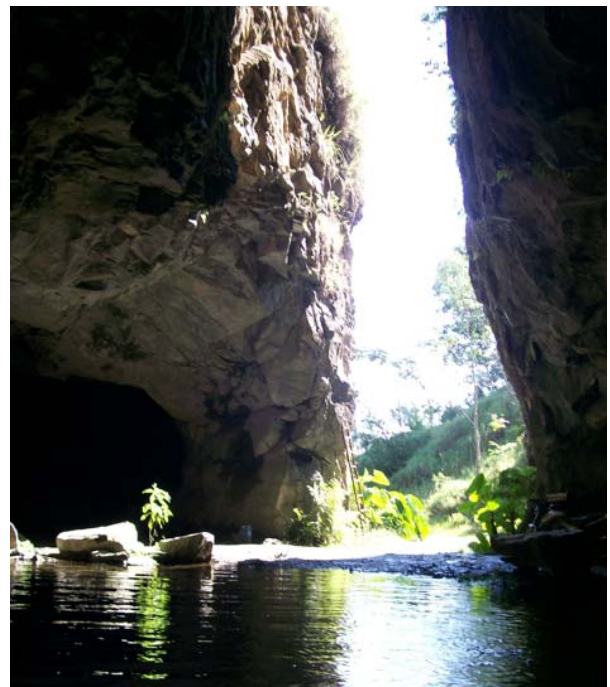
Fotografia 9: Pórtico da Gruta dos Anjos. Érica Nunes, mar. de 2007.

A visita é realizada com auxílio de monitores locais, sendo que, no local, existem monitores com experiência e formação em atividades com PNE's.