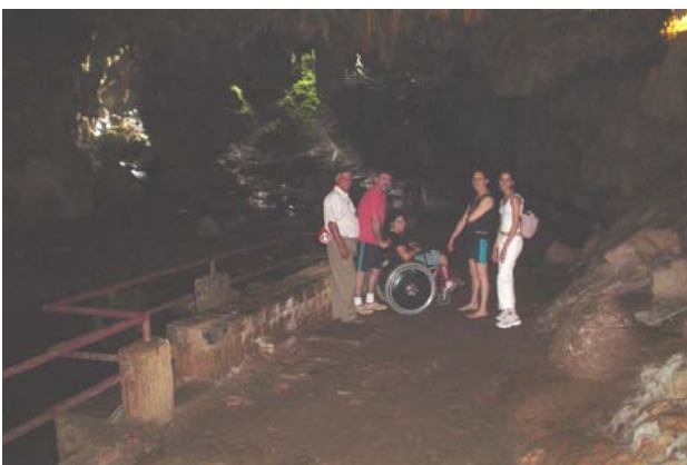
Fotografia 8: Visitação no interior da Caverna do Diabo. Jovenil F. de Souza, dez. de 2006.

No Núcleo, existe um amplo restaurante, banheiros, espaço para artesanato, um pequeno museu natural e chalés para pernoitar. No acesso para estas áreas existem rampas e passagens amplas em quase todos os lugares. Os locais mais inadequados para a visitação do cadeirante são os chalés. Estes possuem portas estreitas o que dificulta a passagem da cadeira de rodas e o banheiro é pequeno e não existem estruturas de apoio.