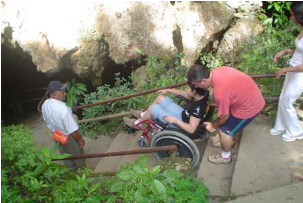
Fotografia 7: Escadaria de acesso a Caverna do Diabo. Jovenil F. de Souza, dez. de 2006.