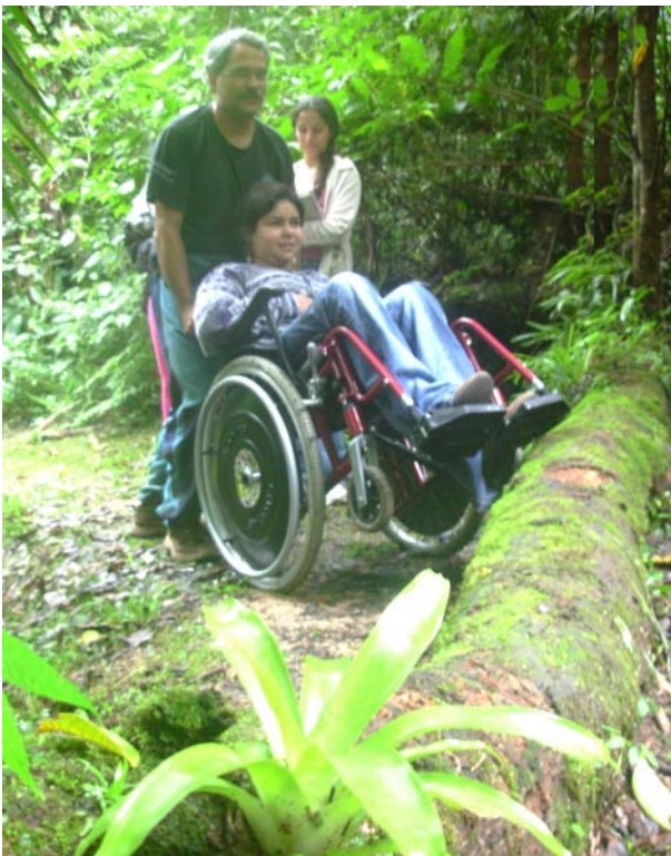
Fotografia 1: Tronco caído (obstáculo) na trilha que leva a Gruta do Chapéu. Robson de A. Zampaulo, fev. de 2007.