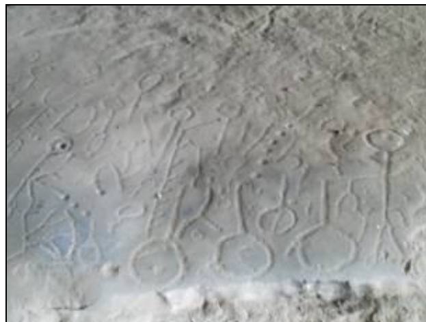
Figura 3 – Grafismos no abrigo Vai2

Vai2: Caracteriza-se por ser um pequeno abrigo onde foram encontrados pedaços de antigas cerâmicas contendo ainda pinturas nas paredes e grafismos no chão.