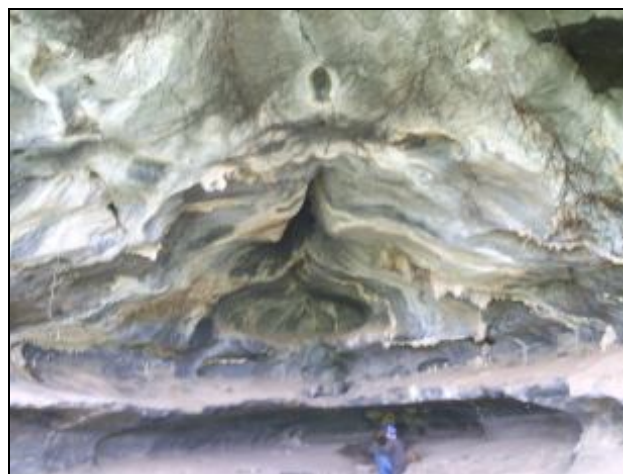
Figura 4 - Abrigo Vai3

Vai3: Maior que a anterior, possui vestígios de cerâmica e ossadas, além de escorrimentos e cortinas de formações belíssimas em suas paredes e no teto. Divide-se em dois grandes salões cuja intensidade da luz difere, sendo que o mais escuro utilizado por animais de pequeno porte da região.