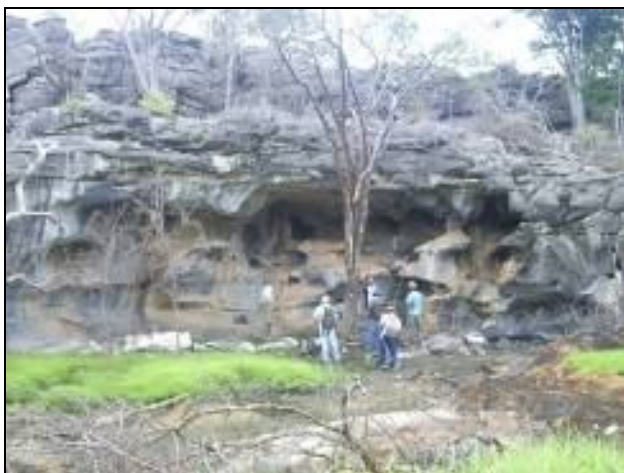
Figura 02 – Abrigo Vai1

Vai1: consiste em um paredão com pinturas rupestres que tem sido ameaçado devido ao desmatamento e queimadas feitas logo à sua frente conforme mostra a Figura 2.